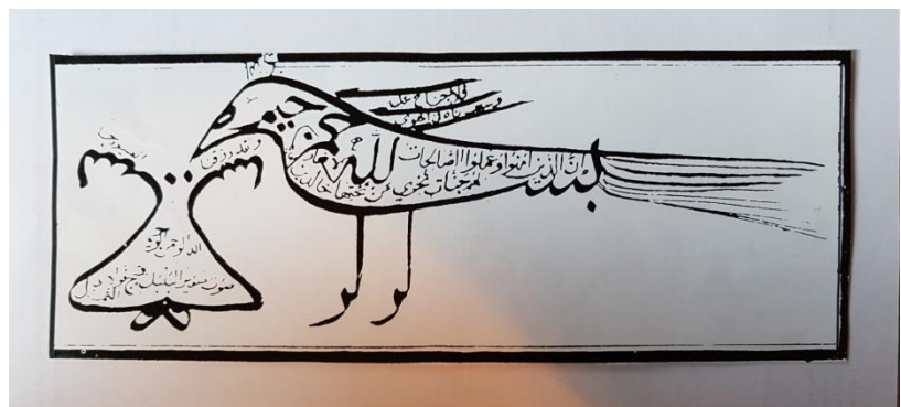
Oiseau sufi buvant et abritant en lui le divin